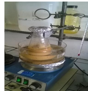
Préparation de solution colorante