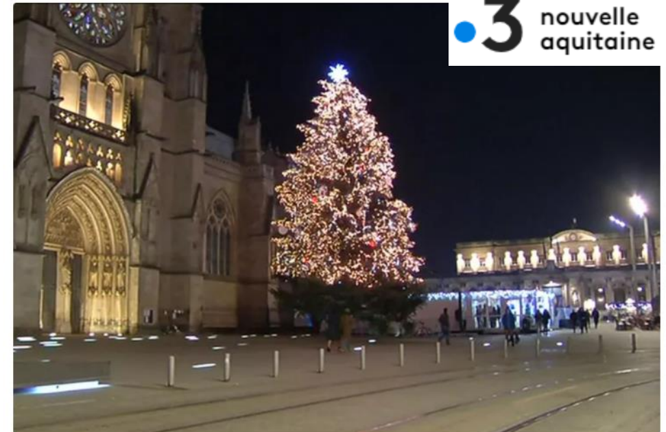
Le traditionnel sapin de Noël de la place Pey-Berland à Bordeaux