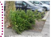
Les trottoirs en janvier...

Chaque année en janvier, après les fêtes de fin d'année, les trottoirs de nos villes sont jonchés d'arbres de Noël. Même s'il s'agit d'une pollution ponctuelle, il n'en demeure pas moins que la gestion de la fin de vie de ces arbres constitue une problématique pour les collectivités. En France, plus de six millions d'arbres sont vendus pour les fêtes [1], constituant une biomasse saisonnière non négligeable. Lorsque ces arbres sont collectés et « recyclés », ils sont généralement broyés pour être utilisés en paillis ou en bois énergie [2].