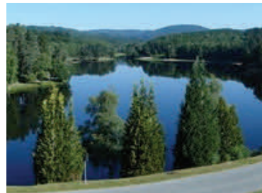
Lac du Deiro