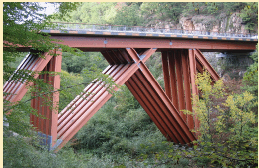
Pont de Merle, Saint-Geniez-ô-Merle, Corrèze (19)

Agents CNRS : Gratuité possible, contacter la formation permanente.