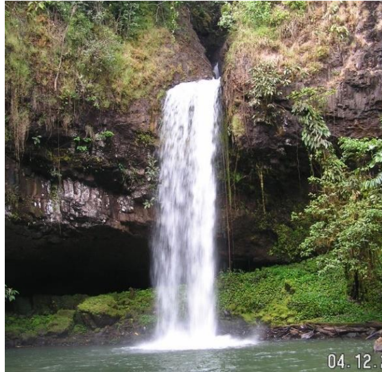
Yodzé, Bakambé 2, Ouest Cameroun